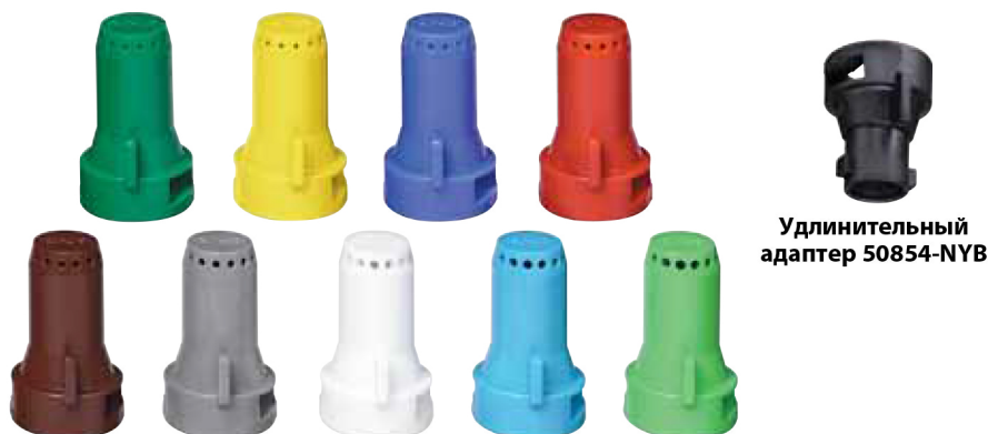
Удлинительный адаптер 50854-NYB